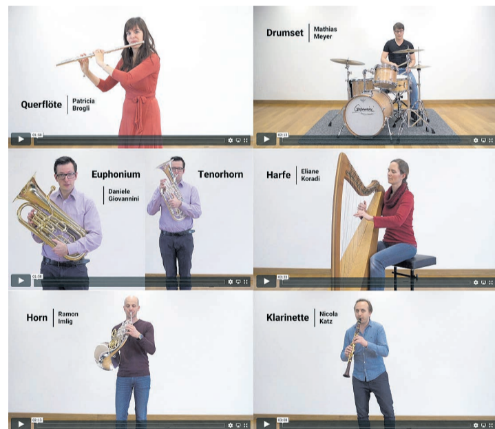
Ein kleiner Auszug aus den insgesamt 31 produzierten Musikschul-Videos, welche auf der Gemeindeforum publiziert sind.

Die ursprünglich geplanten Traktanden, inklusive der Jahresrechnung 2019, werden auf die Gemeindeversammlung vom 14. Dezember 2020 verschoben. Die detaillierte Jahresrechnung 2019 und die in der Vorlage jeweils üblichen Ausführungen werden zeitnah auf der Gemeindeforum aufgeschaltet.