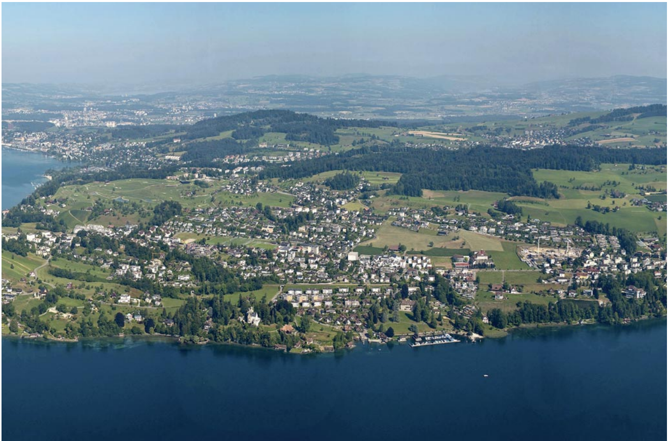
Aktuelle Flugaufnahme der Gemeinde Meggen (Ausschnitt aus dem grossformatigen Wandbild im EG des Gemeindehauses).