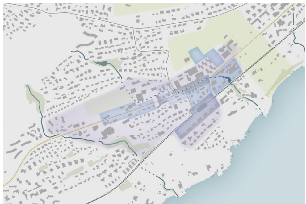
Masterplan Meggen Zentrum gemäss dem gleichnamigen Flyer.