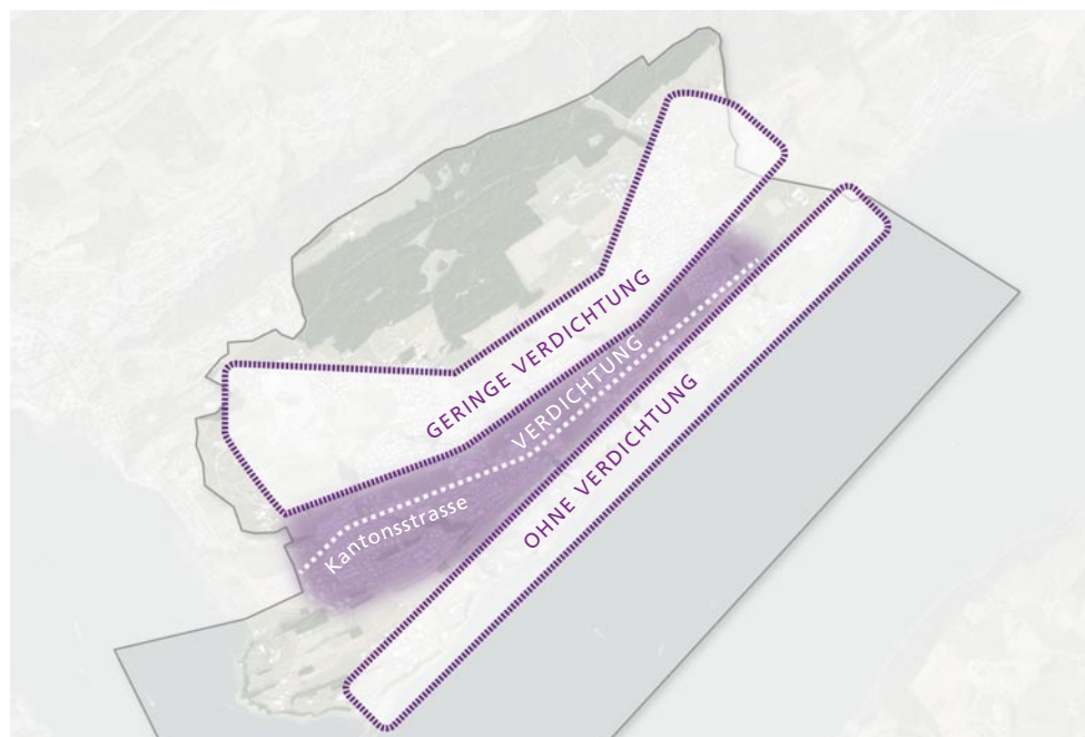
Potenziale zur Innenentwicklung für die einzelnen Quartiere von Meggen.

Basierend auf statistischen Daten wie Einwohner- und Wohnungsdichte, Wohnungsbelegung, Wohnflächen der kantonalen Dienststelle Raum und Wirtschaft (rawi) wurden die quantitativen Potenziale zur Innenentwicklung für die einzelnen Quartiere von Meggen ermittelt (Quartieranalyse, siehe nachfolgende Grafik).